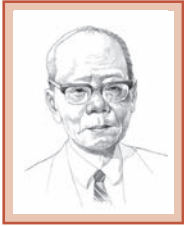
พระยาอนูมานราชชน ฉายเส้นโดย สุลักษณ์ บุณปาน