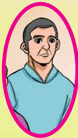
พลวตรียศ