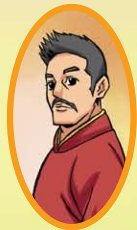
หมื่นราชเสน่หา