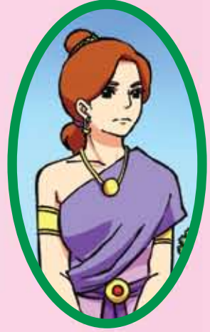
ท้าวศรีสุธาราจันทร์