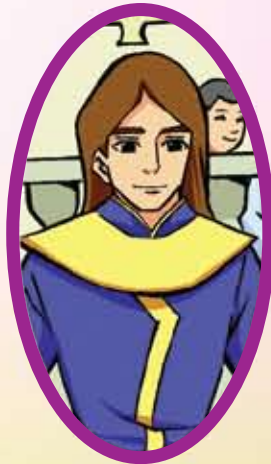
ขุนวรวงศาธิราช