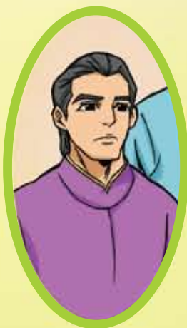
ขุนอินทาบเอภาณ