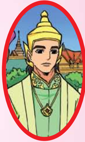
สมเด็จพระมหาจักรพรรดิ