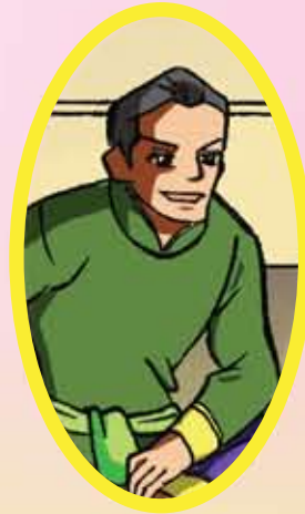
ขุนศรีณรงค์เอภาณ