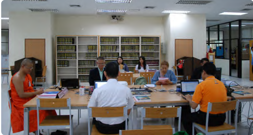
ภาพกิจกรรมการเขียนตำรา ระหว่างวันที่ ๔-๗ เมษายน ๒๕๖๑