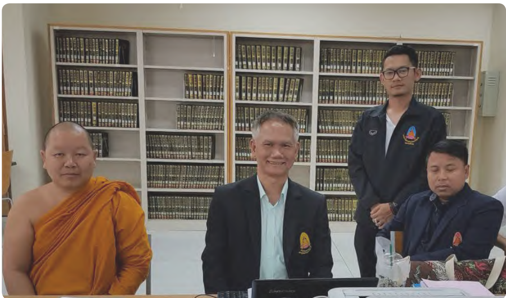
ภาพกิจกรรมการเขียนตำรา ระหว่างวันที่ ๔-๗ เมษายน ๒๕๖๑