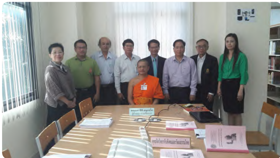
ภาพกิจกรรมการเขียนตำรา ๒๘-๓๐ ก.ค. ๕๙