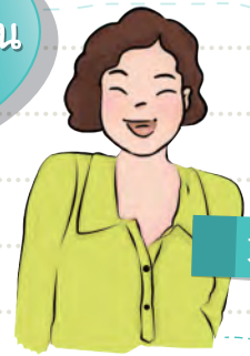
妈妈 แม่เลี้ยวหลัน