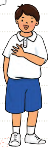
班长 หัวหน้าห้อง