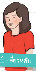
小兰 เลี้ยวหลัน