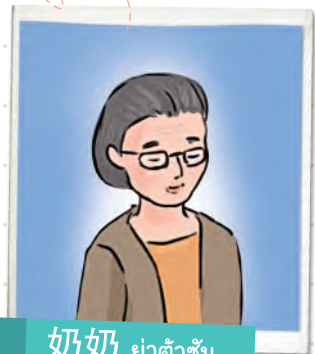
奶奶 ย่าต้าซัน