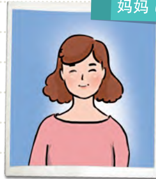
妈妈 แม่ต้าซัน