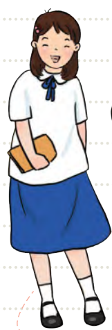
朋友 เพื่อนเลี้ยวหลัน