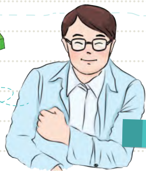
爸爸 พ่อเลี้ยวหลัน