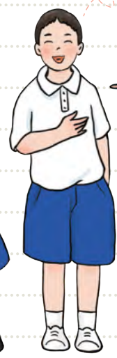
天亮 เทียนเลี้ยง