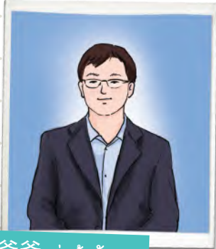
爸爸 พ่อต้าซัน