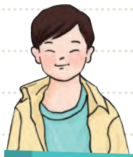
安安 อันอัน