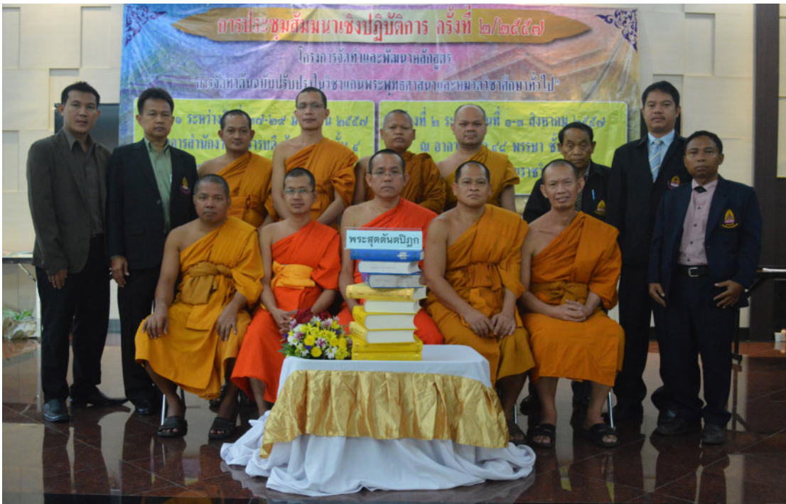
กิจกรรมงานเขียนตำรา ๑-๓ สิงหาคม ๒๕๕๗