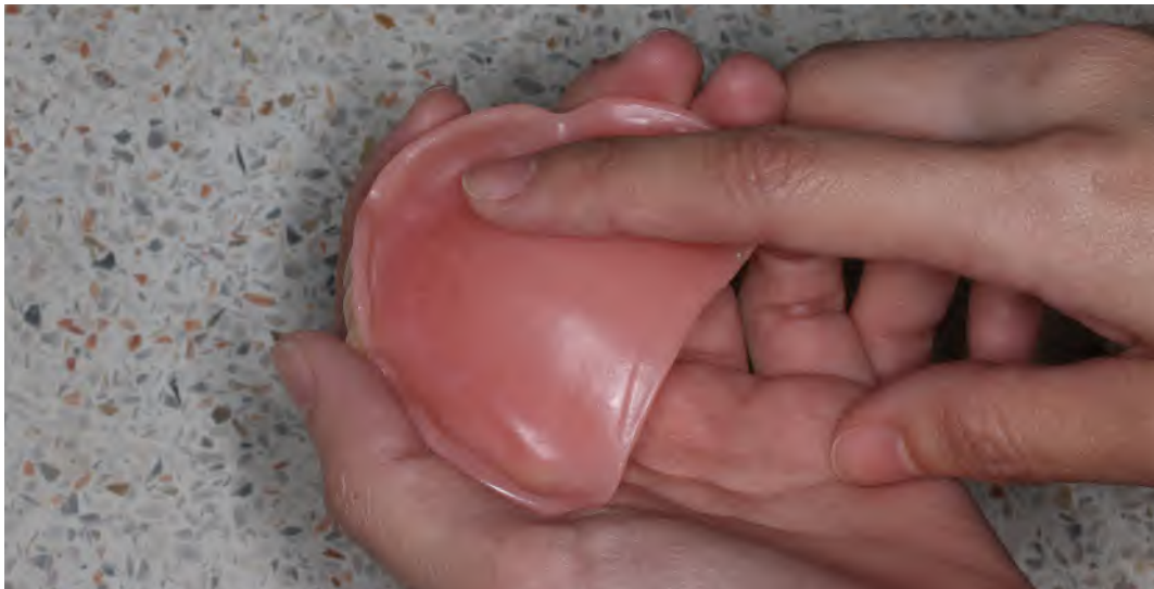
รูปที่ 5.1 การใช้นิ้วมือตรวจสอบผิวด้านสัมผัสเนื้อเยื่อของฐานฟันเทียม เพื่อตรวจสอบตุ่มหรือครีบของเรซินอะคริลิก

1.1.1 ใช้นิ้วมือตรวจสอบผิวด้านสัมผัสเนื้อเยื่อของฐานฟันเทียม หากพบลักษณะของตุ่มหรือครีบของเรซินอะคริลิก ให้ใช้ใบมีดหรือมีดตัดซี่ผึ้งสะกิดออก ก่อนนำไปใส่ในช่องปากผู้ป่วย 1 (รูปที่ 5.1)