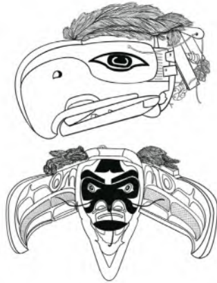
ภาพ 1.1 หน้ากากแปลงกาย (Transformation Mask-Tatltatumtle)

ที่มา : ภาพวาดจากภาพต้นฉบับหน้ากากแปลงกาย ซึ่งจัดแสดง ณ พิพิธภัณฑ์ เกบรองส์-ฌาคส์ ชีราค (Musée du Quai Branly-Jacques Chirac) กรุงปารีส ประเทศฝรั่งเศส