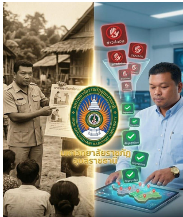
ภาพที่1.2 เปรียบเทียบจากอดีต (การทำงานเชิงรุกในชุมชนแบบดั้งเดิม) สู่ปัจจุบัน (การใช้ข้อมูลดิจิทัล) โดยมีจุดเชื่อมคือการ "คัดกรองความถูกต้อง"

แนวคิด ภาพที่1.2 เปรียบเทียบจากอดีต (การทำงานเชิงรุกในชุมชนแบบดั้งเดิม) สู่ปัจจุบัน (การใช้ข้อมูลดิจิทัล) โดยมีจุดเชื่อมคือการ "คัดกรองความถูกต้อง"