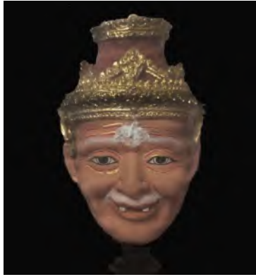
ภาพที่ 1.2 พระภารตมุนี ผู้รจนา “นาฏยศาสตร์”

เรื่องตำนานดังกล่าวมา พวกชาวอินเดียถือว่าที่เมืองจัทัมพรัมอันอยู่ในประเทศอินเดียข้างฝ่ายใต้ (ในมณฑลมัทราส) เป็นที่พระอิศวรได้เสด็จลงมาแสดงตำราฟ้อนรำในมนุษยโลก ครั้นนานมาก็สร้างเทวรูปพระอิศวร ปางเมื่อทรงแสดงการฟ้อนรำ เรียกว่า “นาฏราช” (เราเรียกเทวรูปเช่นนี้ว่า ปางปราบอสูรมุลาคนี) แล้วถ่ายแบบกันสร้างต่อออกไปแพร่หลาย รวมทั้งประเทศไทย เพราะพวกพราหมณ์ที่มาเป็นครูบาอาจารย์ในประเทศไทยก็มาจากอินเดียข้างฝ่ายใต้