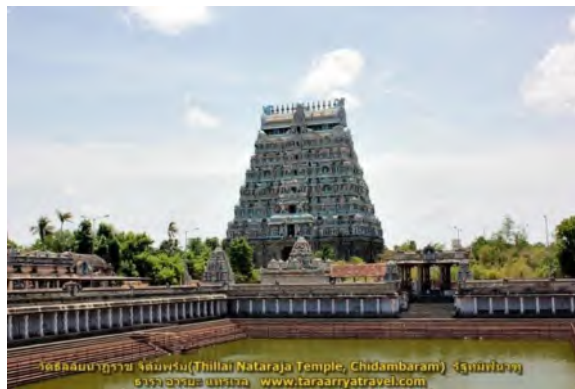
ภาพที่ 1.3 เทวสถานนาฏราช เมืองจัทัมพรัม ประเทศอินเดียตอนใต้

เรื่องตำนานดังกล่าวมา พวกชาวอินเดียถือว่าที่เมืองจัทัมพรัมอันอยู่ในประเทศอินเดียข้างฝ่ายใต้ (ในมณฑลมัทราส) เป็นที่พระอิศวรได้เสด็จลงมาแสดงตำราฟ้อนรำในมนุษยโลก ครั้นนานมาก็สร้างเทวรูปพระอิศวร ปางเมื่อทรงแสดงการฟ้อนรำ เรียกว่า “นาฏราช” (เราเรียกเทวรูปเช่นนี้ว่า ปางปราบอสูรมุลาคนี) แล้วถ่ายแบบกันสร้างต่อออกไปแพร่หลาย รวมทั้งประเทศไทย เพราะพวกพราหมณ์ที่มาเป็นครูบาอาจารย์ในประเทศไทยก็มาจากอินเดียข้างฝ่ายใต้