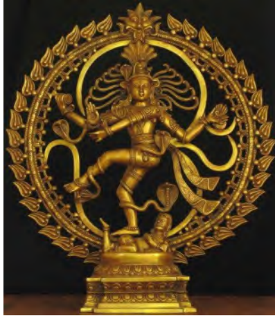
ภาพที่ 1.1 พระอิศวรปางนาฏราช

เมื่อทรมานฤๅษีสำเร็จแล้ว พระอิศวรเสด็จกลับคืนไปยังเขาไกรลาส พระนารายณ์ก็เสด็จกลับคืนไปยังเกษียรสมุทร