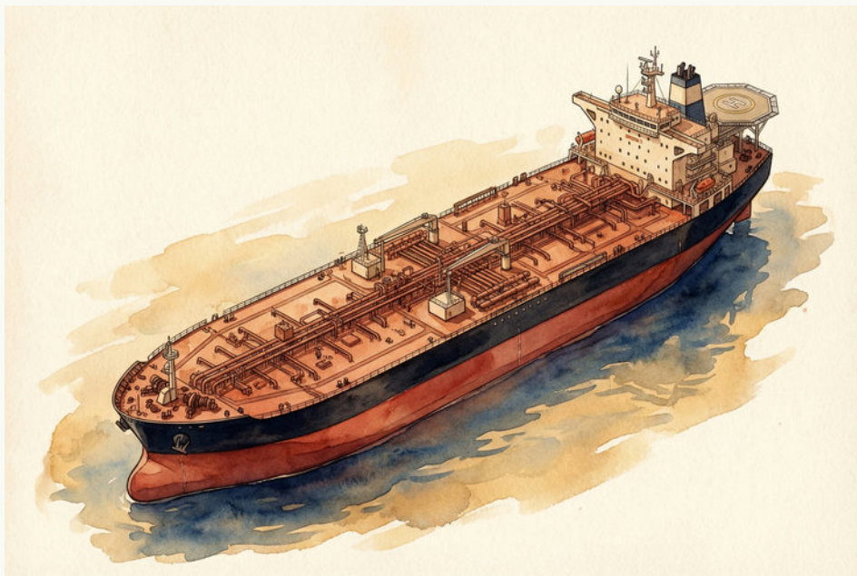
เรือบรรทุกน้ำมันขนาดใหญ่พิเศษที่ต้องสัญจรผ่านพื้นที่จำกัด