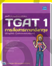
เตรียมพร้อมสอบ TGAT 1 การสื่อสารภาษาอังกฤษ (English Communication)