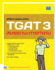
เตรียมพร้อมสอบ TGAT 3 สมรรถนะการทำงาน