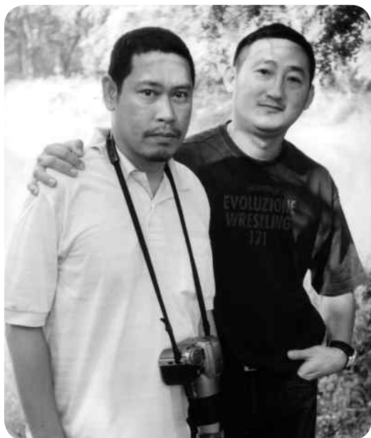
อ่าวกับพี่จิก หน้าอุทยาน เกจิแก้ว

แต่อีกสิ่งหนึ่งที่ผมสนใจ ชอบ และอยากทำมาตลอดก็คือการแต่งเพลง เมื่อมีโอกาส "แต่งเพลง" บ้าง มีโอกาส "เรียนแต่งเพลง" บ้าง และมีโอกาส "ทำเพลง" บ้างในบางช่วงของชีวิต ด้วยความที่เป็นคนเขียนหนังสือผมจึงอยากเขียนถึงสิ่งที่ผมได้ประสบพบเห็นมาในห้วงเวลาต่าง ๆ ของชีวิตที่มีโอกาสไปเกี่ยวของกับเพลง อยากเล่าให้คนที่สนใจฟังเกี่ยวกับคนอยากแต่งเพลง-คนชอบแต่งเพลง การได้มาซึ่งทำนองแต่ละทำนอง เพลงแต่ละเพลง ดนตรี นักร้อง รวมทั้งการได้มาซึ่ง "ครู" ซึ่งไม่มีอยู่ในสารบบของการทำเพลงอาชีพ ทุกอย่างเกิดขึ้นจากสิ่งเดียวคือ "ความอยากของผม"