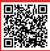
รายละเอียดเพิ่มเติมสแกน