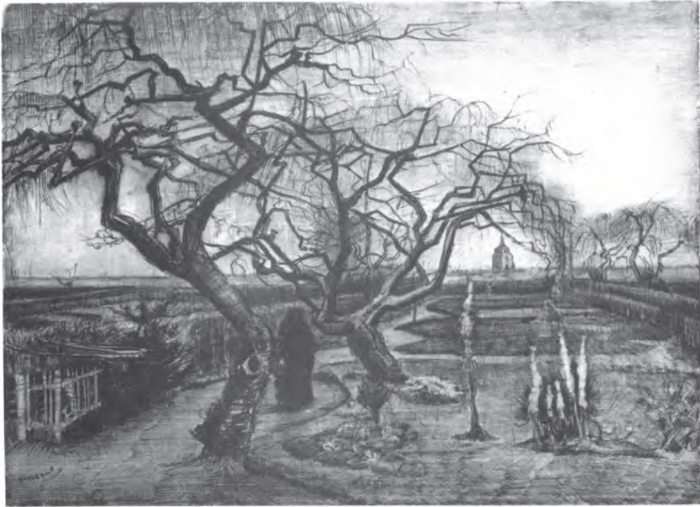
ผลงานวาดเส้นของ วินเซนต์ แวนโก๊ะ