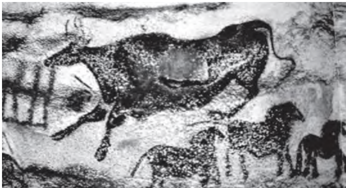
ภาพวาดผนังถ้ำลาสโก, ฝรั่งเศส

การวาดเส้น (Drawing) คือการสื่อความหมายวิธีหนึ่งของมนุษย์ ด้วยกระบวนการทางการวาด, ขูด, ชีด, เขียน, ลากให้เกิดเส้นหรือร่องรอยด้วยวัสดุอย่างใดอย่างหนึ่งลงบนพื้นรองรับ โดยอาศัยเครื่องมือต่าง ๆ ที่ง่ายที่สุดที่จะหาได้ในขณะนั้น เช่น ก้อนหิน, ถ่านไม้, เปลือกไม้, เลือดสัตว์, หรือแม้แต่มือเปล่า