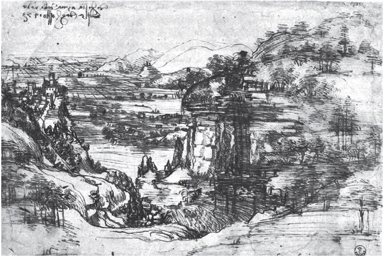
ผลงานวาดเส้นของลีโอนาโด ดา วินชี

ในงานจิตรศิลป์ ศิลปินสามารถสร้างสรรค์และพัฒนาผลงานวาดเส้นไปสู่ความสมบูรณ์ และมีคุณค่าทางศิลปะ จนถึงเป็นผลงานศิลปะชิ้นหนึ่งได้โดยไม่ต้องอาศัยการสร้างสรรค์ด้วยวัสดุชนิดอื่น ขอเพียงศิลปินมีความรู้ความเข้าใจในศิลปะอย่างถ่องแท้ และมีความคิดสร้างสรรค์ก็สามารถสร้างสรรค์งานวาดเส้นให้มีสุนทรียภาพได้