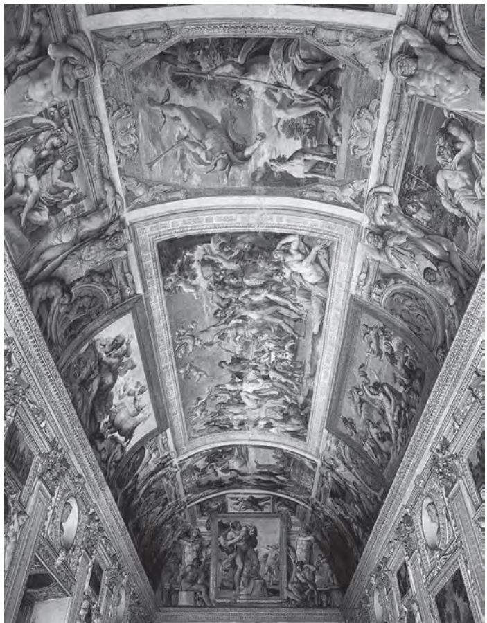
ภาพจิตรกรรมผนังปูนเปียก (Fresco) ในวิหารซิสทีน กรุงโรม อิตาลี

ในเอเชีย ภาพทิวทัศน์เก่าแก่คือภาพวาดพู่กันจีน ซึ่งส่วนใหญ่จะเป็นภาพทิวทัศน์ธรรมชาติล้วนๆ และมักจะแสดงจินตนาการความกว้างใหญ่ของภูมิประเทศ เช่นภูเขาที่ดงาม ภาพทิวทัศน์ของชาวจีนมักจะสอดแทรกด้วยน้ำตก อาจมีภาพคนอยู่ในรูปก็จะเป็นส่วนประกอบที่ไม่สำคัญหรือเป็นเพียงสิ่งเทียบถึงขนาดของธรรมชาติ และเป็นการเชิญชวนให้ผู้ชมภาพรู้สึกมีส่วนร่วมในภาพเขียนเท่านั้น