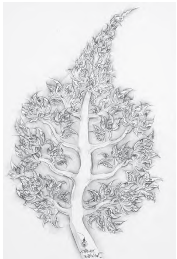
ผลงานวาดเส้นของ อังคาร กัลยาณพงศ์

ประเทือง เอมเจริญ ศิลปินแห่งชาติ กล่าวไว้ว่า “ในการทำงานศิลปะตั้งแต่เริ่มต้นจนถึงปัจจุบัน ข้าพเจ้าได้ใช้การวาดเส้นเป็นจุดเริ่มต้นของการเรียนรู้ธรรมชาติและสร้างลักษณะเฉพาะตน นอกจากนั้น การวาดเส้นยังเป็นจุดของการก่อให้เกิดสมาธิ การวาดเส้นจึงเปรียบเสมือนกุญแจที่จะไขไปสู่กระบวนการแห่งความงามของศิลปะที่ง่ายและตรงที่สุด การฝึกฝนงานวาดเส้นจะต้องพยายามกระทำให้ต่อเนื่องโดยตลอด ตา มือ และจิตใจ จะต้องสัมพันธ์กันเป็นสมาธิ การวาดเส้นควรดำเนินตัวเองไปอย่างอิสระ โดยไม่มีการกำหนดเงื่อนไขใดๆ ไว้ก่อน ทั้งในด้านรูปแบบและการแสดงออก และเมื่อใดที่เรารู้สึกได้ถึงพลังที่ผ่านเข้าสู่เส้น จิตใจของเราจะพบกับความอิสระเบิกบาน ในขณะนั้น เราจะได้สัมผัสกับความงามของศิลปะและสามารถสร้างสรรค์ได้โดยไม่มีที่สิ้นสุด”