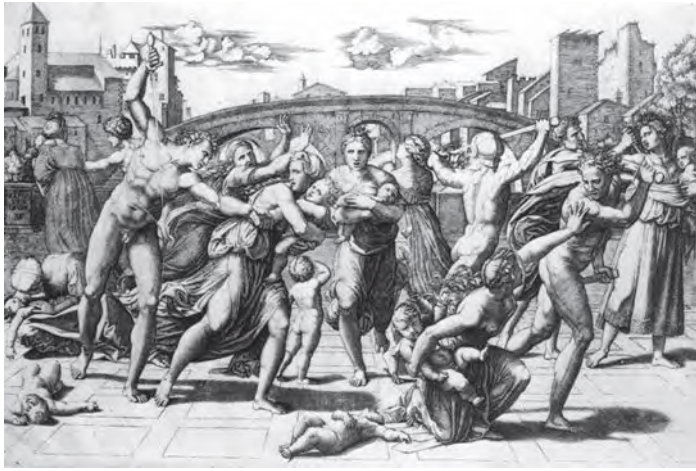
ผลงานวาดเส้นของราฟาเอล