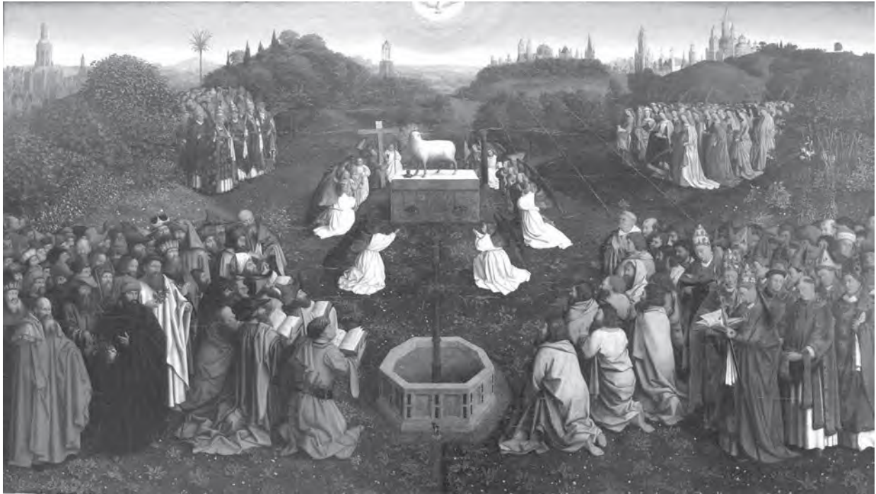
ผลงานภาพทิวทัศน์ของ Jan Van Eyck