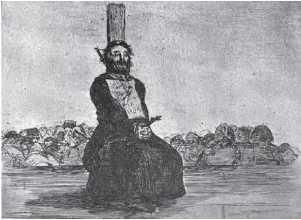
ผลงานวาดเส้นของฟรานซิสโก โกยา