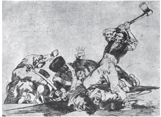
ผลงานวาดเส้นของฟรานซิสโก โกยา

โกยา (Francisco Goya) ศิลปินมีชื่อในศตวรรษที่ 18 กล่าวว่า “บางครั้งความคิด และจินตนาการของศิลปินก็เกิดขึ้นอย่างรวดเร็วมากจนไม่อาจจะรอคอยเพื่อเตรียมวัสดุในการสร้างสรรค์ได้ ในขณะที่วิธีการวาดเส้นสะดวกและรวดเร็วกว่า และสามารถสร้างสรรค์ให้เป็นผลงานศิลปะที่สมบูรณ์ได้” ทำให้ศิลปินยุคต่อๆ มามีได้ละเลยผลงานวาดเส้นของตน เช่นในยุคของ เดอกาส (Degas) ได้นำสีชอล์คมาสร้างสรรค์ผลงานวาดเส้นจนเป็นที่เลื่องชื่อ วินเซนต์ แวนโก๊ะ (Vincent Van Gogh) ก็สร้างสรรค์ผลงานวาดเส้นที่ทรงคุณค่าไว้ถึงกว่า 600 ภาพ ในช่วงชีวิตของเขา