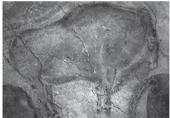
ภาพวาดผนังถ้ำอัลตามิรา, สเปน

การวาดเส้นมีมาตั้งแต่มนุษย์เริ่มมีวิวัฒนาการขึ้น หลักฐานสำคัญของการใช้เส้นเพื่อสื่อสารของมนุษย์พบในถ้ำอัลตามิรา ประเทศสเปน และถ้ำลาสโก ประเทศฝรั่งเศส สมัยก่อนประวัติศาสตร์ มนุษย์ได้ใช้กิ่งไม้ ใช้เลือดสัตว์ ก้อนหิน กระดูกสัตว์ ฯลฯ ขูด ชีด แกะ ลาก บนผนังถ้ำให้เกิดร่องรอย เกิดเป็นสัญลักษณ์ เป็นภาษาขึ้นมา เป็นภาพวาดรูปมนุษย์ สัตว์ ต้นไม้ อาวุธ ฯลฯ นับเป็นการบันทึกเรื่องราวและการสื่อสารยุคแรกๆ ของมนุษย์ ต่อมาได้มีการค้นพบการวาดเส้น การแกะสลักสัญลักษณ์ในที่ต่างๆ อีก เช่น บนกระดูกสัตว์ บนเปลือกไม้ที่ถูกอัดฝังแน่นอยู่นานจนกลายเป็นฟอสซิล รวมถึงบนหินและโลหะอีกด้วย จนกระทั่งมนุษย์มีกระดาษใช้ เชื่อกันว่าจีนเป็นประเทศแรกที่ผลิตกระดาษขึ้นมา ก่อนหน้านั้นชาวจีนจะเขียนอักษรและภาพลงบนไม้ไผ่เป็นซี่ๆ แล้วม้วนเก็บเป็นตำรา ภายหลังเมื่อคิดผลิตกระดาษได้ก็ใช้หมีกบันทึกเรื่องราวลงบนกระดาษ และวิวัฒนาการมาจนถึงการพิมพ์ภาพ ซึ่งเชื่อกันอีกว่า ชาวจีนเป็นชาติแรกที่คิดวิธีการพิมพ์ขึ้นมาในโลก