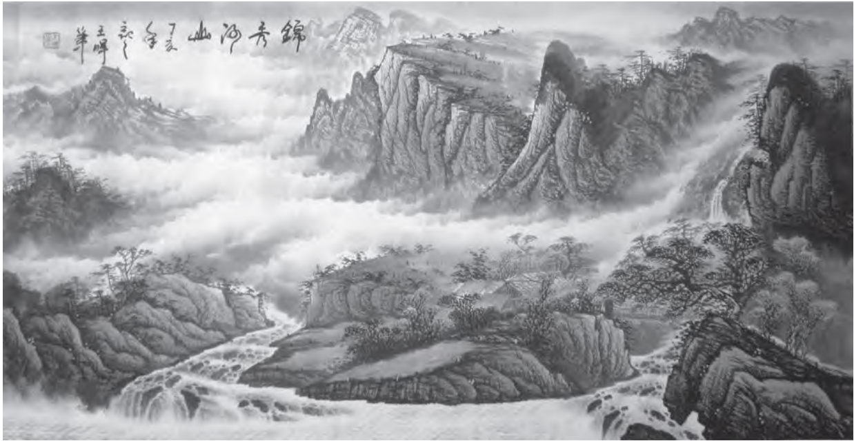
ภาพทิวทัศน์พู่กันจีน

ภาพทิวทัศน์แนวประเพณีของจีน ศิลปินมักจะแก้ปัญหาเรื่องระยะด้วยการเปิดพื้นที่ว่าง (Open Form) หรือลดความคมชัดของระยะหลังที่ไม่ต้องการนำเสนอ ซึ่งตรงกับสภาพภูมิประเทศที่มีความสลับซับซ้อนและเต็มไปด้วยหมอก ภาพทิวทัศน์ทางฝั่งตะวันตกมักจะแสดงเนื้อหาเกี่ยวกับจินตนาการและปรัชญา ในขณะที่ภาพทิวทัศน์ของฝั่งตะวันตกจะแสดงเนื้อหาที่เกี่ยวข้องกับประวัติศาสตร์และศาสนาเป็นส่วนใหญ่