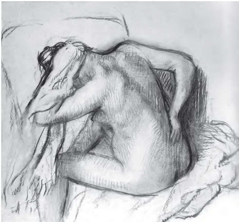
ผลงานวาดเส้นของเอ็ดการ์ เดอกาส์