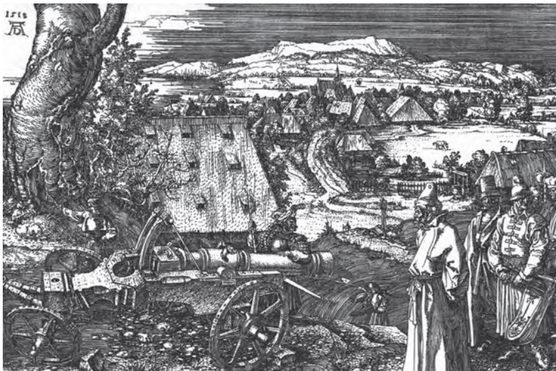
ภาพลายเส้นทิวทัศน์ของ Albrecht Dürer