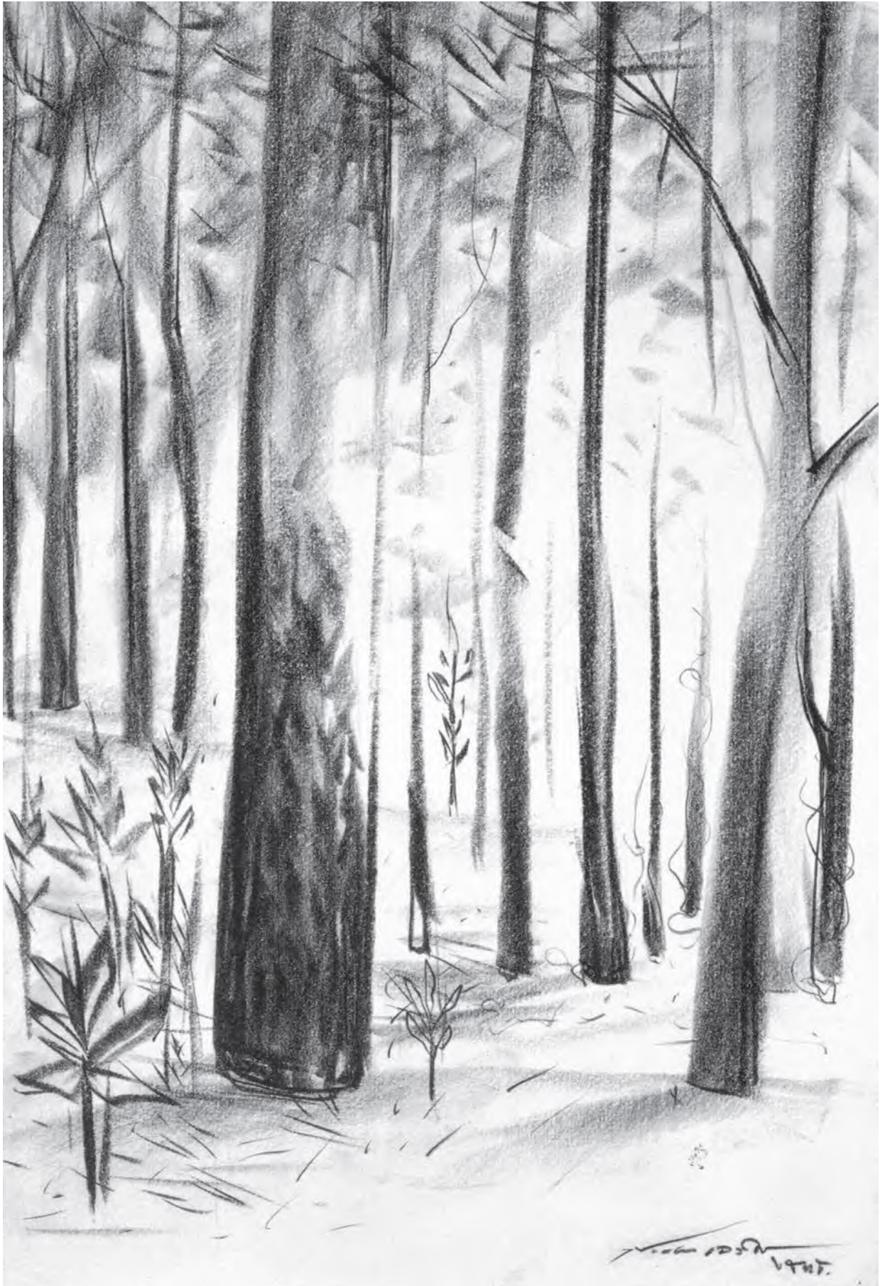
ผลงานวาดเส้นของ ประเทือง เอมเจริญ