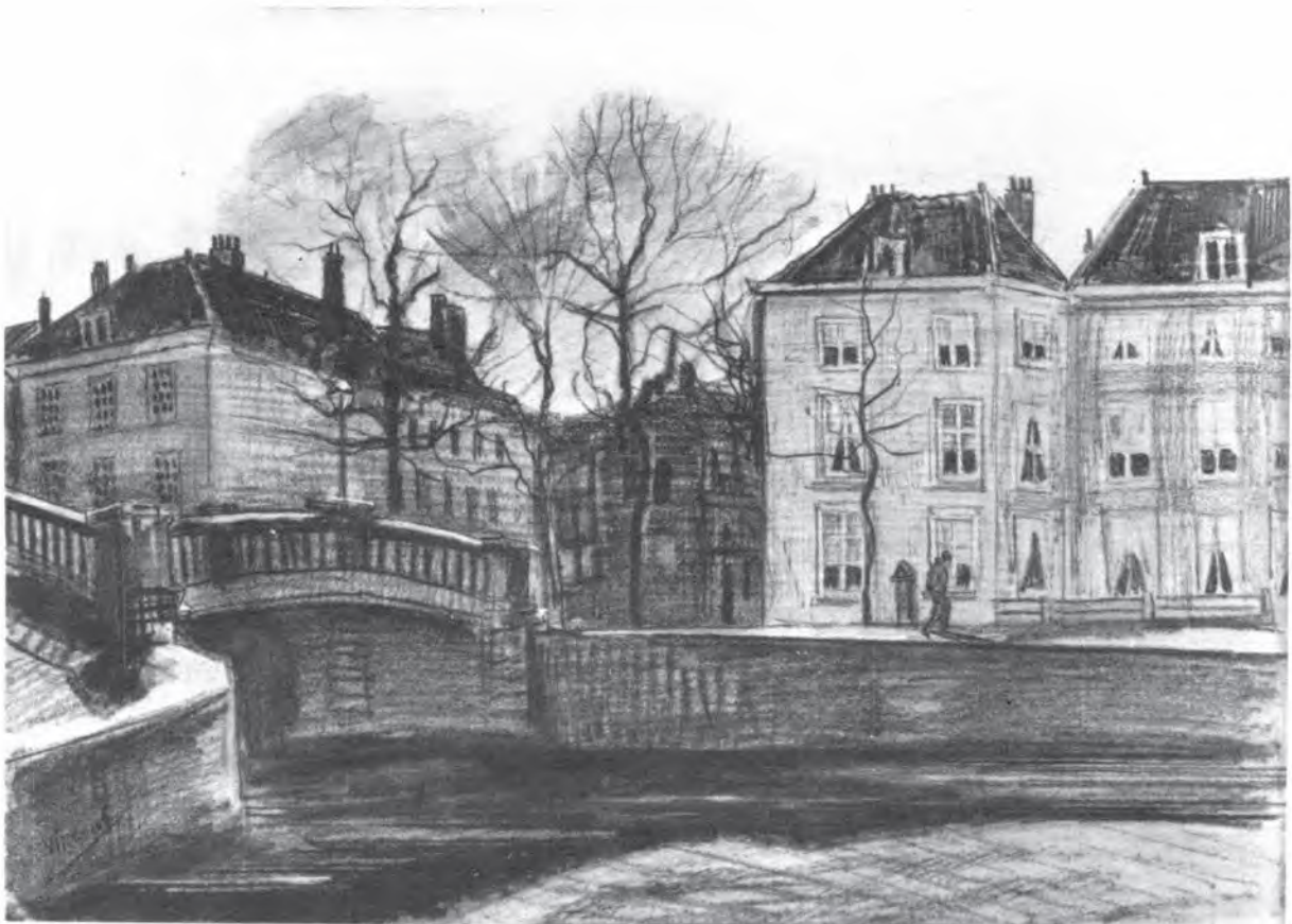
ผลงานวาดเส้นของ วินเซนต์ แวนโก๊ะ

โกยา (Francisco Goya) ศิลปินมีชื่อในศตวรรษที่ 18 กล่าวว่า “บางครั้งความคิด และจินตนาการของศิลปินก็เกิดขึ้นอย่างรวดเร็วมากจนไม่อาจจะรอคอยเพื่อเตรียมวัสดุในการสร้างสรรค์ได้ ในขณะที่วิธีการวาดเส้นสะดวกและรวดเร็วกว่า และสามารถสร้างสรรค์ให้เป็นผลงานศิลปะที่สมบูรณ์ได้” ทำให้ศิลปินยุคต่อๆ มามีได้ละเลยผลงานวาดเส้นของตน เช่นในยุคของ เดอกาส (Degas) ได้นำสีชอล์คมาสร้างสรรค์ผลงานวาดเส้นจนเป็นที่เลื่องชื่อ วินเซนต์ แวนโก๊ะ (Vincent Van Gogh) ก็สร้างสรรค์ผลงานวาดเส้นที่ทรงคุณค่าไว้ถึงกว่า 600 ภาพ ในช่วงชีวิตของเขา