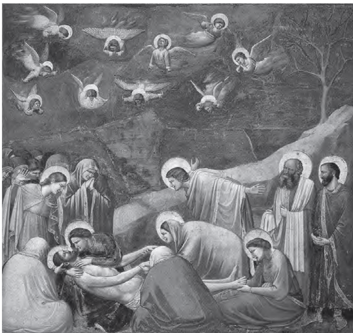
ภาพวาดของ Giotto di Bondone

ทางฝั่งญี่ปุ่น ได้มีการนำวัฒนธรรมการวาดภาพแบบจีนไปพัฒนาจนมีความเป็นเอกลักษณ์ ภาพทิวทัศน์ของญี่ปุ่นมักจะแสดงเรื่องราวของพระราชวังที่มีภูมิประเทศอันสวยงามเป็นฉากหลังและมักจะจัดภาพในมุมสูง