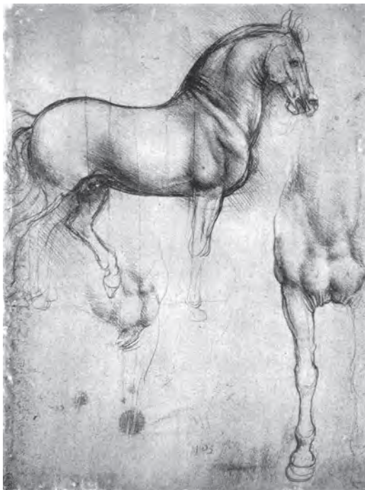
ผลงานวาดเส้นของลีโอนาโด ดา วินชี

ในศตวรรษที่ 15 ศิลปินยอมรับว่าการวาดเส้นเป็นปัจจัยสำคัญในการนำเสนอความคิดของตนและยังช่วยให้ศิลปินสามารถศึกษาและพัฒนาด้านศิลปะได้อย่างถ่องแท้ การวาดเส้นจึงเป็นขั้นตอนสำคัญของศิลปะทั้งหมด และยังได้รับการยอมรับอีกว่า งานวาดเส้นสามารถสร้างความงามโดยตัวของมันเองได้ดังเช่นผลงานภาพร่างลายเส้นสำหรับการเขียนเฟรสโกของมิเคลันเจโล และลีโอนาโด ดา วินชี