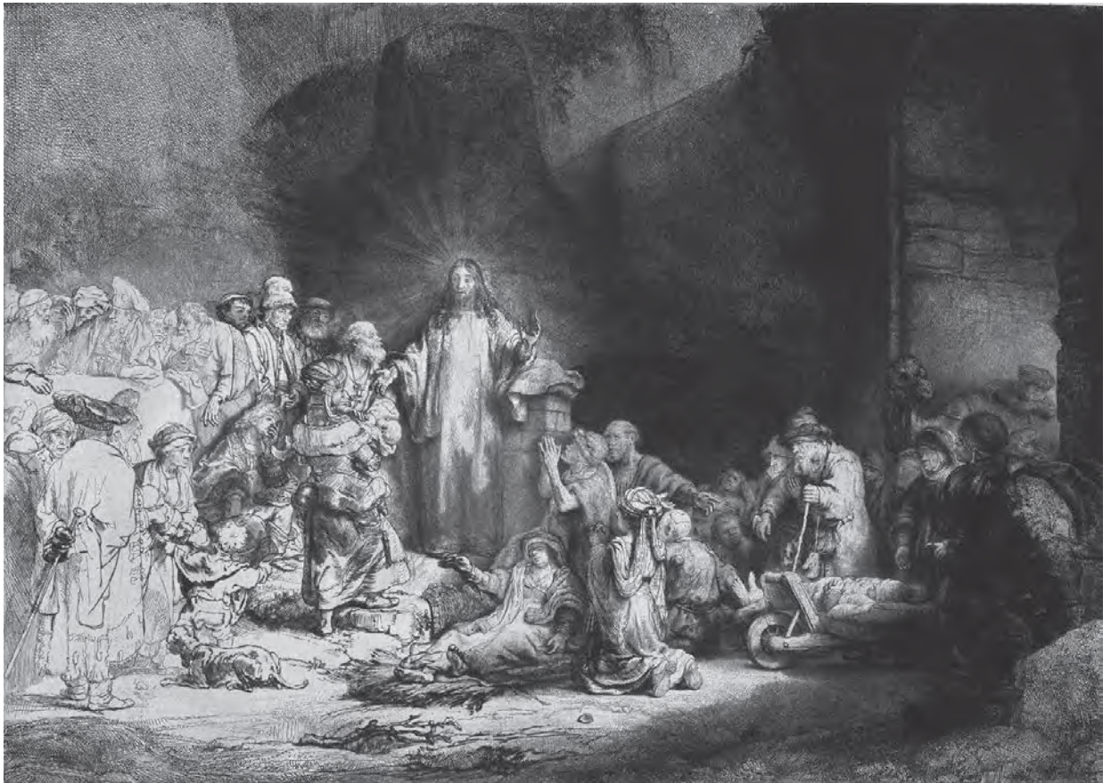
ผลงานวาดเส้นของเรมบรันด์