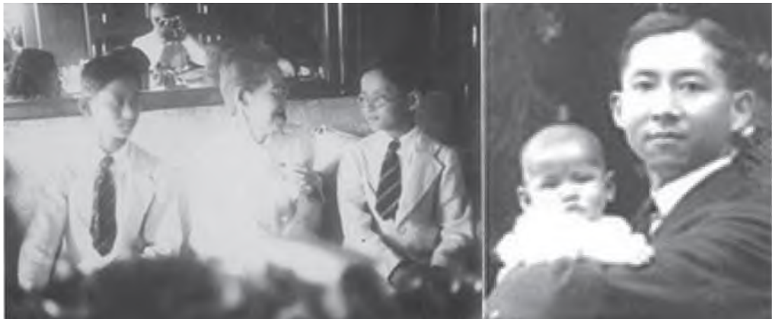
รูปที่ 1.1 ด้านหน้าจากขวามาซ้าย

เมื่อ พ.ศ. 2471 ได้เสด็จกลับสู่ประเทศไทยพร้อมพระบรมราชชนก ซึ่งทรงสำเร็จการศึกษาปริญญาแพทยศาสตรบัณฑิตเกียรตินิยมจาก มหาวิทยาลัยฮาร์วาร์ด สหรัฐอเมริกา พร้อมด้วยสมเด็จพระบรมราชชนนี สมเด็จพระเจ้าพี่นางเธอ และสมเด็จพระเชษฐาธิราช โดยประทับ ณ วังสระปทุม ต่อมาวันที่ 24 กันยายน พ.ศ. 2472 สมเด็จพระบรมราชชนกสวรรคต ขณะที่พระบาทสมเด็จพระเจ้าอยู่หัวมีพระชนมายุไม่ถึงสองพรรษา