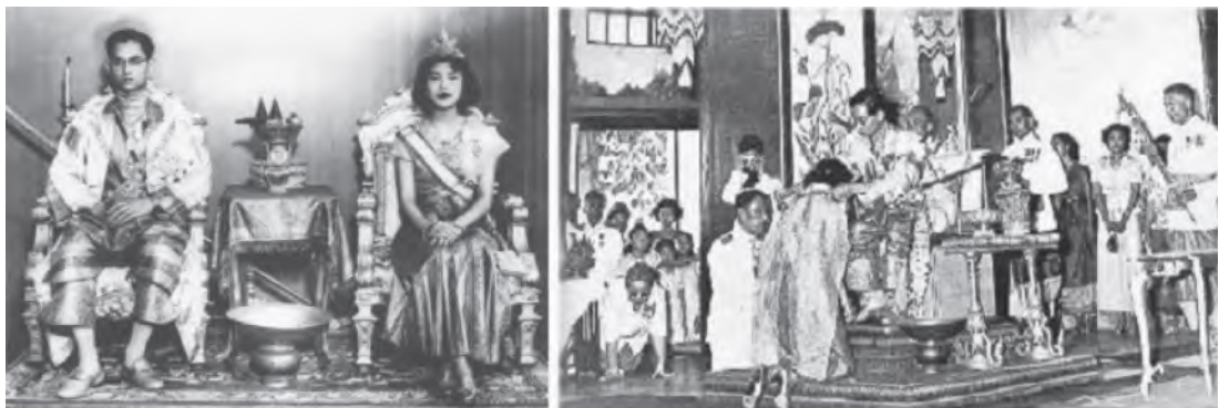
รูปที่ 1.4 พระราชพิธีราชาภิเษกสมรส

วันที่ 5 พฤษภาคม พ.ศ. 2493 ทรงพระกรุณาโปรดเกล้าโปรดกระหม่อมให้ตั้งการพระราชพิธีบรมราชาภิเษกตามแบบอย่างโบราณราชประเพณีขึ้น ณ พระที่นั่งไพศาลทักษิณ เฉลิมพระปรมาภิไธยตามที่จารึกในพระสุพรรณบั้กว่า พระบาทสมเด็จพระปรมินทรมหาภูมิพลอดุลยเดช มหาจักรีบรมราชูปถัมภ์ จักรีนฤพดินทร สยามมินทราธิราช บรมนาถบพิตร พระราชทานพระปฐมบรมราชโองการว่า เราจะครองแผ่นดินโดยธรรม เพื่อประโยชน์สุขแห่งมหาชนชาวสยาม ในโอกาสนี้พระองค์ทรงพระราชดำริว่า ตามโบราณราชประเพณี เมื่อสมเด็จพระมหากษัตริย์ราชเจ้าได้เสด็จเถลิงถวัลยราชสมบัติบรมราชาภิเษกแล้ว ย่อมโปรดให้สถาปนาเฉลิมพระเกียรติยศสมเด็จพระอัครมเหสีขึ้นเป็นสมเด็จพระบรมราชินี ดังนั้น พระองค์จึงทรงพระกรุณาโปรดเกล้าฯ ให้ประกาศสถาปนาเฉลิมพระเกียรติยศสมเด็จพระราชินีสิริกิติ์ ขึ้นเป็น สมเด็จพระนางเจ้าสิริกิติ์ พระบรมราชินี