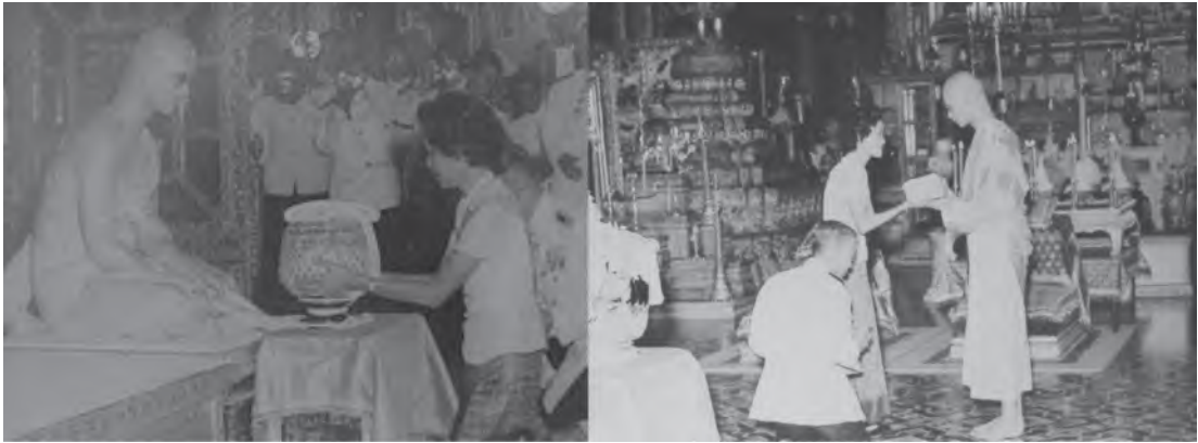
รูปที่ 1.6 พระบาทสมเด็จพระเจ้าอยู่หัวทรงรับบาตร ขณะผนวช

ระหว่างที่ทรงดำรงสมณเพศ พระภิกษุพระบาทสมเด็จพระเจ้าอยู่หัวทรงปฏิบัติพระราชกิจ เช่นเดียวกับพระภิกษุทั้งหลายอย่างเคร่งครัด เช่น เสด็จลงพระอุโบสถทรงทำวัตรเช้า-เย็น ตลอดจนทรงสวดพระธรรมและพระวินัย นอกจากนี้ยังได้เสด็จพระราชดำเนินไปทรงปฏิบัติพระราชกรณียกิจพิเศษอื่นๆ เช่น ในวันที่ 24 ตุลาคม พ.ศ. 2499 ได้เสด็จพระราชดำเนินไปยังวัดพระศรีรัตนศาสดาราม ทรงร่วมสังฆกรรมในพิธีผนวชและอุปสมบทนาคหลวงในพระบรมราชินูปถัมภ์ ในวันที่วันที่ 28 ตุลาคม พ.ศ. 2499 เสด็จฯ ไปทรงรับบิณฑบาต จากพระบรมวงศานุวงศ์และข้าทูลละอองธุลีพระบาท ณ พระที่นั่งอัมพรสถาน ในโอกาสนี้สมเด็จพระบรมโอรสาธิราช เจ้าฟ้ามหาวชิราลงกรณ สยามมกุฎราชกุมาร ครั้นยังเป็นสมเด็จพระเจ้าลูกยาเธอ ได้เข้าเฝ้าทูลละอองธุลีพระบาทด้วย