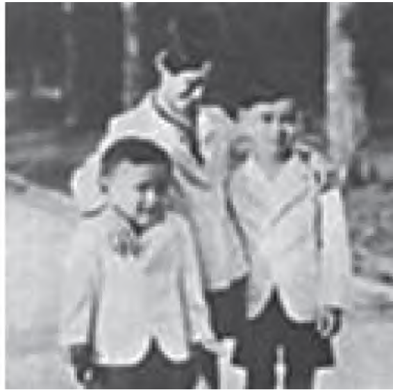
รูปที่ 1.2 การศึกษาขณะทรงพระเยาว์

ครั้นถึงวันที่ 2 มีนาคม พ.ศ. 2477 พระบาทสมเด็จพระปกเกล้าเจ้าอยู่หัว ทรงประกาศสละราชสมบัติรัฐบาลจึงกราบทูลอัญเชิญ พระวรวงศ์เธอ พระองค์เจ้าอานันทมหิดล ซึ่งสืบสายราชสันตติวงศ์ ลำดับที่ 1 และมีพระชนมายุเพียง 9 พรรษา เสด็จเถลิงถวัลยราชย์ เป็นพระมหากษัตริย์องค์ที่ 8 แห่งพระบรมราชจักรีวงศ์ ซึ่งได้ทรงสถาปนา พระวรวงศ์เธอ พระองค์เจ้าภูมิพลอดุลยเดช เป็นสมเด็จพระเจ้าน้องยาเธอ เจ้าฟ้าภูมิพลอดุลยเดช เมื่อวันที่ 10 กรกฎาคม พ.ศ. 2478 ทรงสถาปนา หม่อมสังวาลย์ มหิดล ณ อยุธยา เป็นพระราชชนนีศรีสังวาลย์ และทรงสถาปนา พระวรวงศ์เธอ พระองค์เจ้ากัลยาณิวัฒนาเป็นสมเด็จพระเจ้าพี่นางเธอ เจ้าฟ้ากัลยาณิวัฒนา