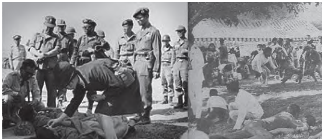
รูปที่ 1.7 เหตุระเบิดที่ยะลา 22 กันยายน พ.ศ. 2520

ในวันที่ 22 กันยายน 2520 เวลา 15.15 น. ขณะที่พระบาทสมเด็จพระเจ้าอยู่หัว, สมเด็จพระ พระบรมราชินีนาถและสมเด็จพระเจ้าลูกเธอทั้งสองพระองค์ทรงประทับบน พลับพลาที่ประทับ ซึ่งมี ประชาชนมาเฝ้ารับเสด็จฯ ราว 30,000 คน ก็ได้มีราษฎรที่มาเฝ้ารับเสด็จฯ ไปหยิบไฟแช็คดังกล่าวเป็นเหตุ ให้ระเบิดลูก แรกเกิดระเบิดขึ้น ราษฎรต่างพากันแตกตื่นและเหยียบกับระเบิดลูกที่สอง ทำให้ระเบิดลูก ที่สองเกิดระเบิดขึ้น ระเบิดลูกแรกห่างจากพลับพลาที่ประทับ 60.15 เมตร ห่างจากลาดพระบาท 5.20 เมตร และระเบิดลูกที่สองห่างจากพลับพลาที่ประทับ 105.15 เมตร ห่างจากลาดพระบาท 6.00 เมตร แรงระเบิดทำให้มีผู้ได้รับบาดเจ็บ 55 คน บาดเจ็บสาหัส 11 คน ขณะที่เกิดความโกลาหลนั้น บรรดา เจ้าหน้าที่และผู้บังคับบัญชาลูกเสือชาวบ้านได้เข้าระงับควบคุมฝูงชน อย่างฉับพลัน