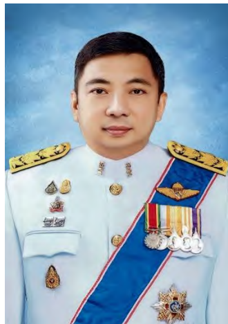
พันตำรวจโท ประวุธ วงศ์สีนิล อธิบดีกรมราชทัณฑ์ (ข้อมูลเมื่อปี 2568)