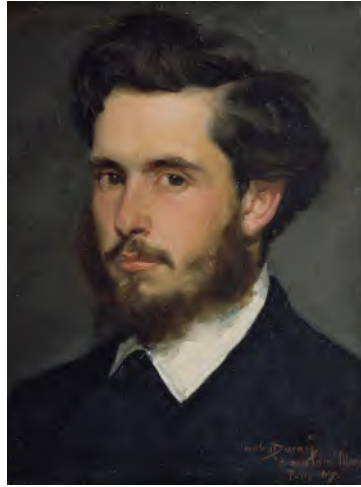
คลอด โมแนต์ ๑๘๔๐ - ๑๙๒๖