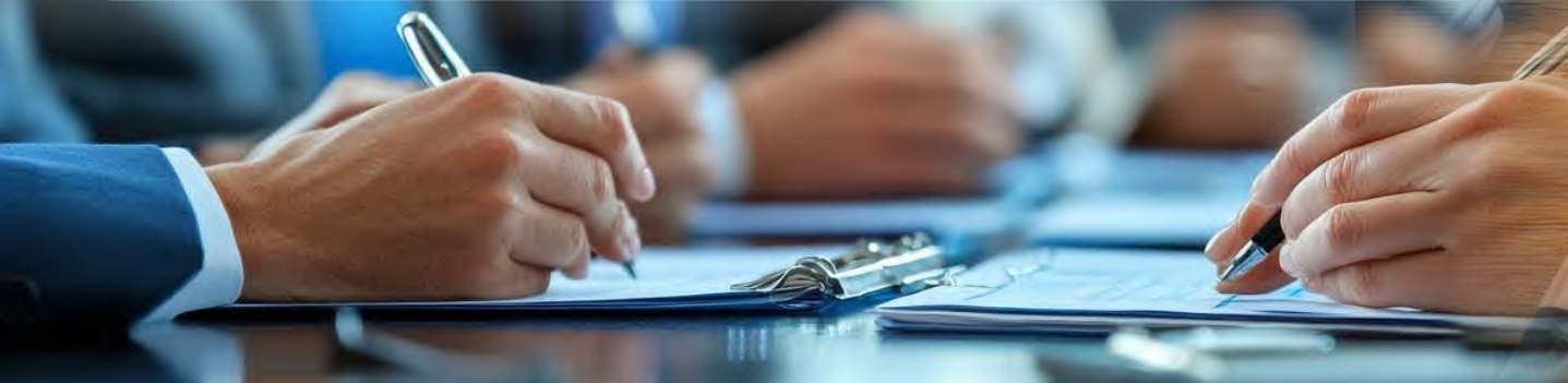
รูปที่ 1.1 การประกอบธุรกิจมีจุดมุ่งหมายที่สำคัญคือกำไร (ที่มา : https://pixabay.com )