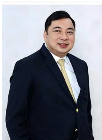
พันตำรวจโท ประสุร วงศ์สิน อธิบดี กรมพินิจและคุ้มครองเด็กและเยาวชน