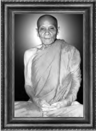
หลวงปู่บัว สิริบุญโณ