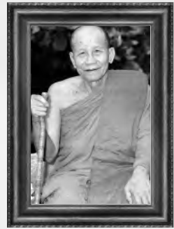
หลวงปู่เพ็ง พุทฺธมโม