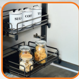
ฟังก์ชันภายในตู้จัดเก็บเป็นตะแกรง อะลูมิเนียมเคลือบไทเทเนียม สามารถวางของได้จุใจ