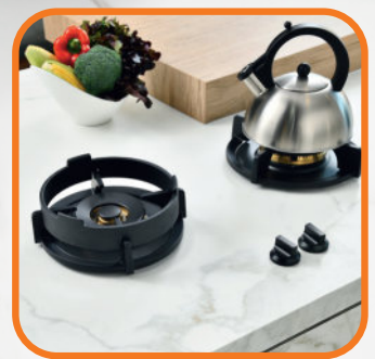
ติดตั้งเตาแก๊สแบบหัว ฝังเข้ากับเคาน์เตอร์ไอส์แลนด์ ดูกลมกลืนสวยงาม