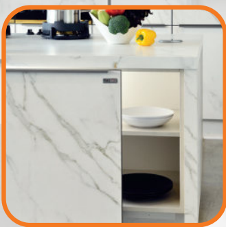
ด้านหน้าไอส์แลนด์ออกแบบเป็นหน้าบานสไลด์ ประหยัดเนื้อที่ในการเปิด-ปิด และหยิบของใช้ได้ง่าย