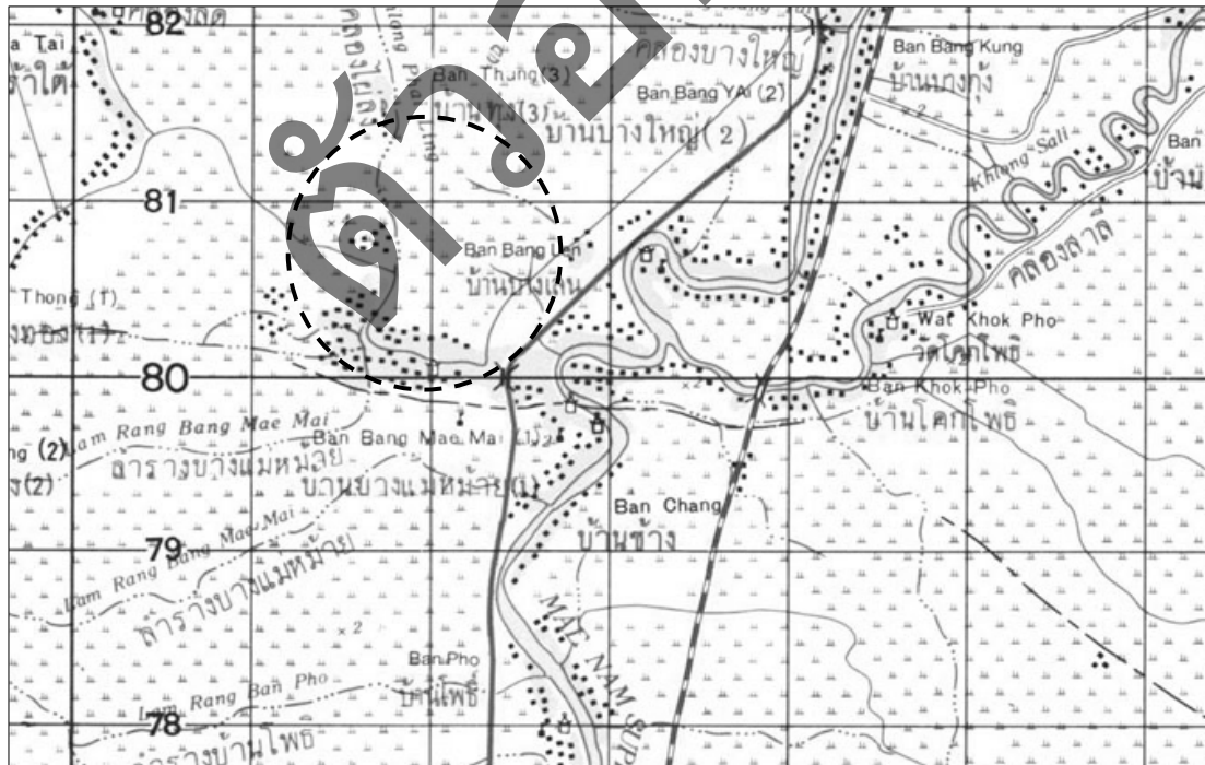
รูปที่ 4-2 แผนที่มาตราส่วน 1 : 50,000