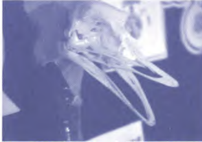
▲ โครงสร้างกะโหลกของนกกระจอกเทศ

- ปีกสั้น ประกอบด้วยขนปีกซึ่งเป็นขนอ่อนๆ ขนาดยาวโค้งลง และมีหางสั้น