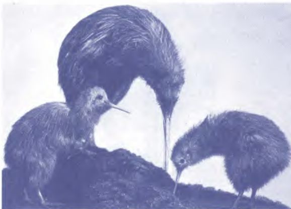
▲ นกกีวีเป็นสัญลักษณ์ของประเทศนิวซีแลนด์

1. นกกีวี (Kiwi) มีถิ่นกำเนิดอยู่ในประเทศนิวซีแลนด์และถือเป็นสัญลักษณ์ของประเทศนี้ด้วย ตัวไม่ใหญ่ ตัวโตเต็มที่จะมีน้ำหนักเพียง 3-4 กิโลกรัมเท่านั้น