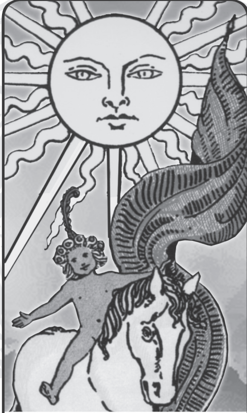
XIX THE SUN