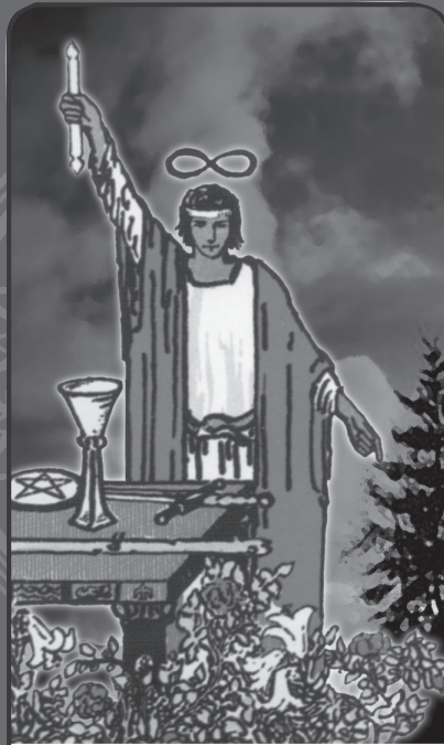
I THE MAGICIAN

บุคคลที่มีอะไรพิเศษในตัวและได้รับการคัดเลือกแล้ว ดาวประจำตัว : ดาวพุธ (เมอคิวรี)