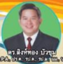
ดร.สิงห์ทอง บัวชุม OPA, ป.ค., พ.ค., รมว.ก.น., รม.