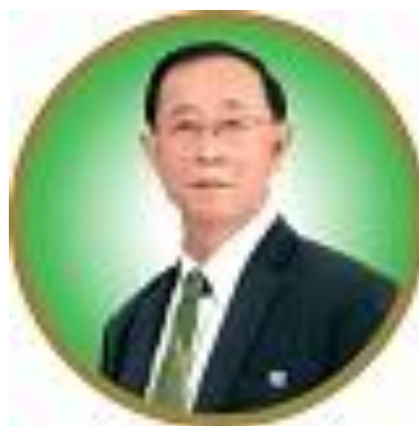
นายอคม เดิมพิทยาไพสิฐ รัฐมนตรีว่าการกระทรวงการคลัง ตำแหน่ง ประธานกรรมการ ธ.ก.ส.

พื้นสีน้ำเงิน หมายถึง สีของกระทรวงการคลัง ซึ่ง ธ.ก.ส. เป็นรัฐวิสาหกิจสังกัดกระทรวงการคลัง