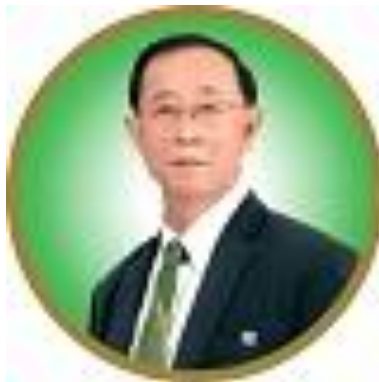
นายอคม เดิมพิทยาไพสิฐ รัฐมนตรีว่าการกระทรวงการคลัง ตำแหน่ง ประธานกรรมการ ธ.ก.ส.

พื้นสีน้ำเงิน หมายถึง สีของกระทรวงการคลัง ซึ่ง ธ.ก.ส. เป็นรัฐวิสาหกิจสังกัดกระทรวงการคลัง