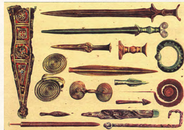
เครื่องมือเครื่องใช้ / อาวุธ ยุคเหล็ก