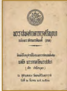
เอกสารพื้นเมืองในรูปของพงศาวดาร