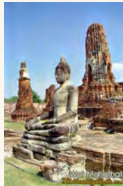
วัดมหาธาตุ จ.พระนครศรีอยุธยา