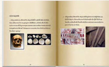
แบบเรียนวิชาประวัติศาสตร์