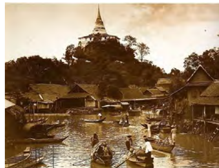
วิถีชีวิตคนไทยในสมัยรัตนโกสินทร์ตอนต้น

หากพิจารณาแล้วจึงพบว่า ประวัติศาสตร์จะเกิดขึ้นได้ด้วยองค์ประกอบสำคัญ ได้แก่ สังคมมนุษย์ หลักฐาน มิติของเวลาและวิธีการทางประวัติศาสตร์ โดยขั้นแรกต้องมีเหตุการณ์หรือพฤติกรรมในสังคมมนุษย์เกิดขึ้น แต่เนื่องจากสังคมมนุษย์เกิดขึ้นมากกว่า 500,000 ปีมาแล้ว