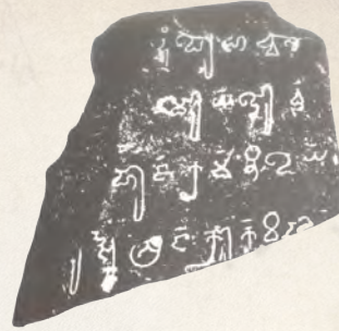
จารึกวัดโพธิ์ จ.นครปฐม