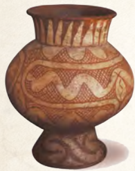
ภาชนะดินเผาลายเขียนสี ศิลปะบ้านเชียง

นักประวัติศาสตร์บางท่านแบ่งหลักฐานประวัติศาสตร์ออกไปเป็น หลักฐานขั้นที่สาม หรือ ตติยภูมิ (Tertiary Sources) หมายถึง หลักฐานที่เขียนหรือรวบรวมขึ้นจากหลักฐานปฐมภูมิ และทุติยภูมิ เพื่อประโยชน์ในการศึกษาอ้างอิง และผ่านการรับรองความถูกต้องจากแหล่งความรู้ที่เชื่อถือได้ เช่น สารานุกรม หนังสือแบบเรียน และบทความทางประวัติศาสตร์ต่าง ๆ