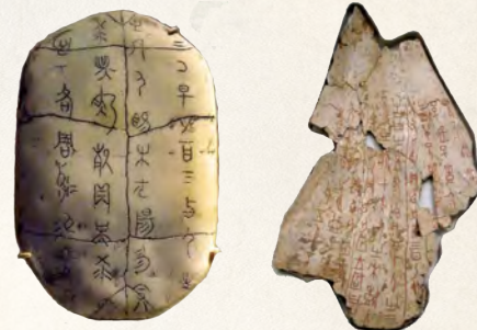
กระดุกเสียดของเงินจารึกบนกระดองเต่า กระดุกแก้ว ที่มา : popopiyonggugu.blogspot.com