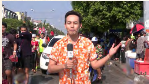
ผู้สื่อข่าวรายงาน “วันไหล พัทยา”