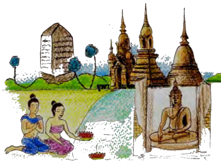
วิถีชีวิตคนไทยในสมัยอาณาจักรสุโขทัย