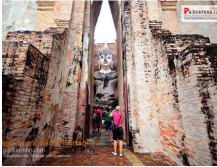
มรดกโลกอาณาจักรสุโขทัย “วัดศรีชุม”