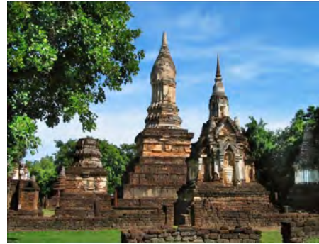
มรดกโลกอาณาจักรสุโขทัย “วัดเจติยเจ็ดแถว”