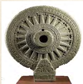
ธรรมจักร แสดงหลักฐานการนับถือศาสนาพุทธ สมัยทวารวดี

- จดหมายเหตุ : เป็นการจดบันทึกเหตุการณ์ที่เกิดขึ้นในช่วงเวลาหนึ่งที่มีการระบุ วัน เดือน ปี เวลาที่เกิดขึ้นจึงนับว่าเป็นหลักฐาน “ลายลักษณ์อักษร” ที่มีความถูกต้อง ชัดเจนในเรื่องของเวลามากที่สุด