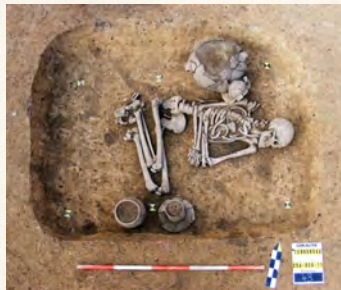
โครงกระดูกมนุษย์แสดงถึงวิถีชีวิตและชาติพันธุ์ของมนุษย์แต่ละยุคได้