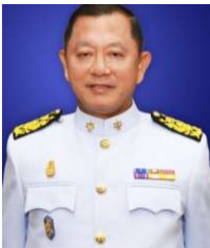
พลเอก ชนะทัฬห อันทามระ