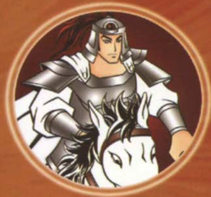
ມ້າເສີຍຈ