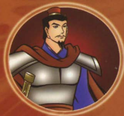
ຍິ່ງມາເສີຍຈ