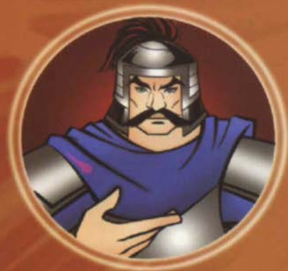
ឆើមឆត្តិច