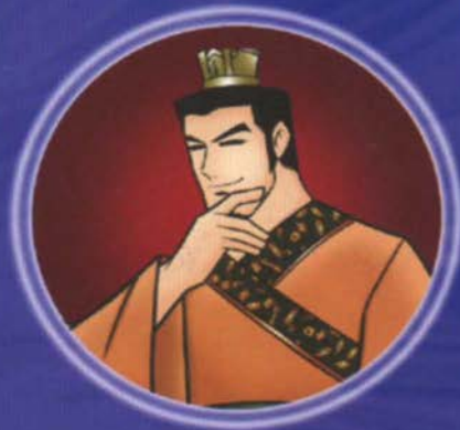
មើមពង្រីក