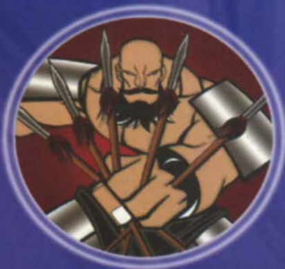
តើមនុស្ស