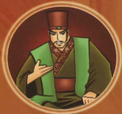
ຫ້າມກິ່ງ