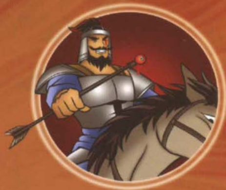
ឃាត់អ៊ុយធីង